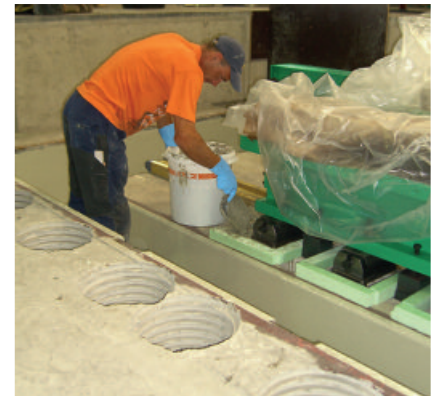
Verguss einer Maschinenverankerung mit PCI Repaflow Plus