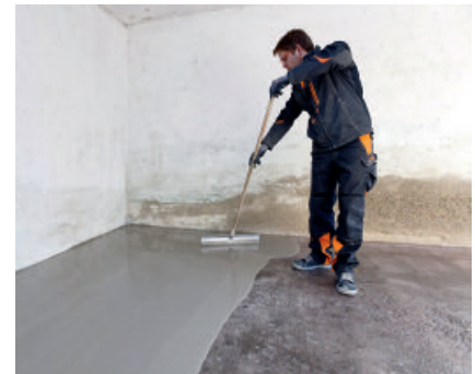
Vollflächiger Bodenausgleich mit leicht verlaufendem PCI Zemtec ® Outdoor für direkte Nutzbarkeit.