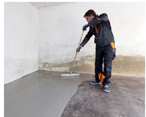
Vollflächiger Bodenausgleich mit leicht verlaufendem PCI Zemtec ® Outdoor für direkte Nutzbarkeit.