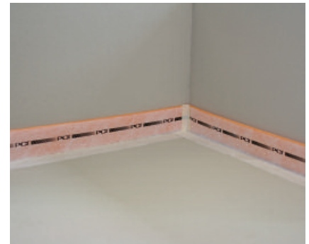
Mit dem selbstklebenden Randdämmstreifen PCI Pecitape Silent können Schallbrücken einfach und wirkungsvoll verhindert werden.