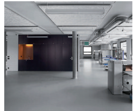
Mit PCI Apoten PU hergestellte, verschleißfeste und chemikalienbeständige Beschichtung für den Innenbereich