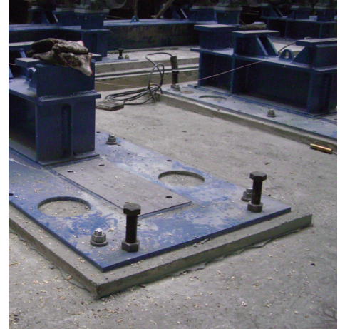
PCI Repaflow schafft eine nahtlose, risse- und hohlraumfreie Verbindung, die einen ruhigen Maschinenverlauf und dadurch präziseres Arbeiten und geringeren Maschinenverschleiß bewirkt.

Frei liegende Mörtelflächen mit feuchten Tüchern oder Polyethylenfolie vor Austrocknung schützen. Die Schalung kann nach ca. 12 Stunden entfernt werden.