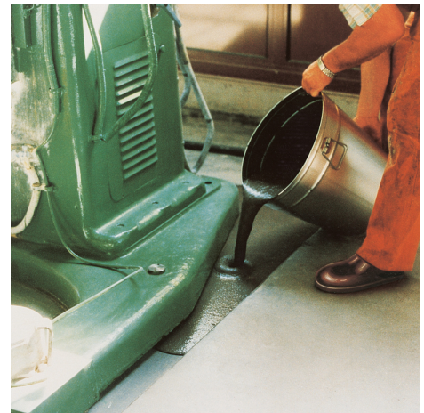
PCI Repaflow ist fließfähig und füllt horizontale Hohlräume selbstverlaufend.