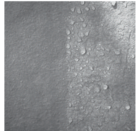
Abperleffekt durch Hydrophobierung mit PCI Silconal 303.