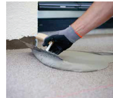
PCI Flexmörtel® S2 Rapid vorlegen und als Kratzspachtelung ausführen