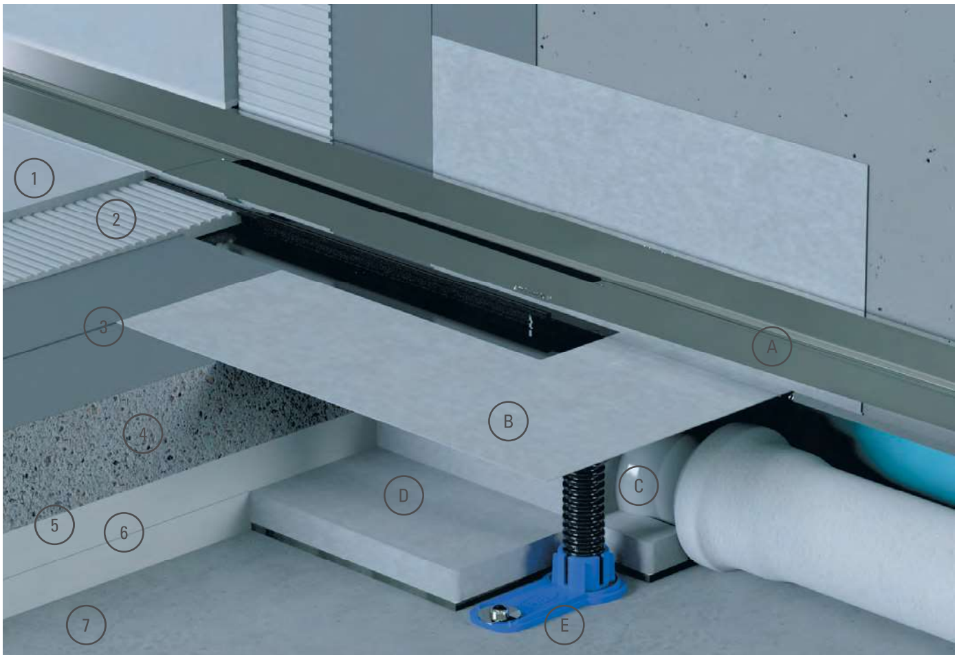
System- und Bodenaufbau am Beispiel CeraWall Select mit Ablaufgehäuse DallFlex und Schallschutzelement (Einbau gemäß P-BA 148/2015 geeignet für die Erfüllung der erhöhten Schallschutzanforderungen nach DIN 4109 und VDI 4100)