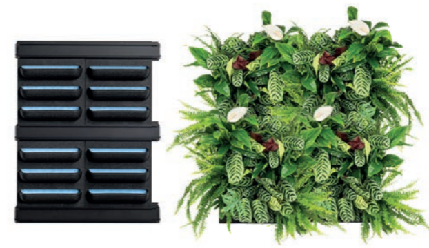
2 X 2