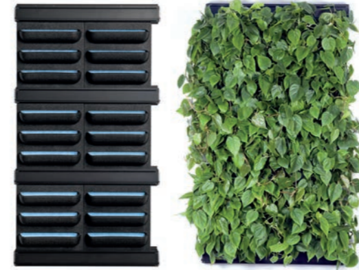
2 X 3