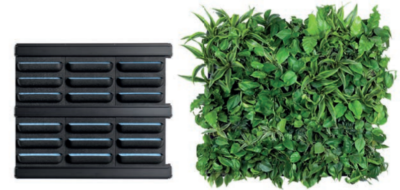
3 X 2