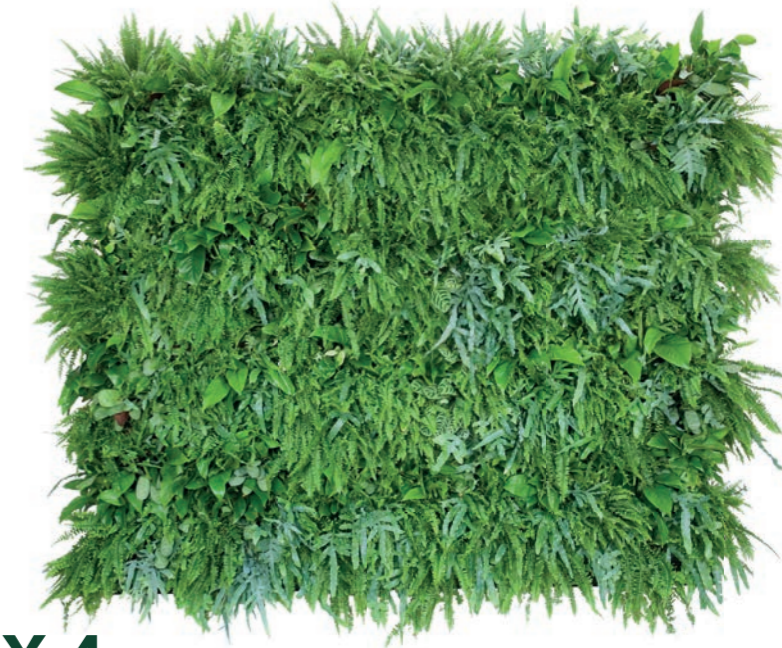
6 X 4