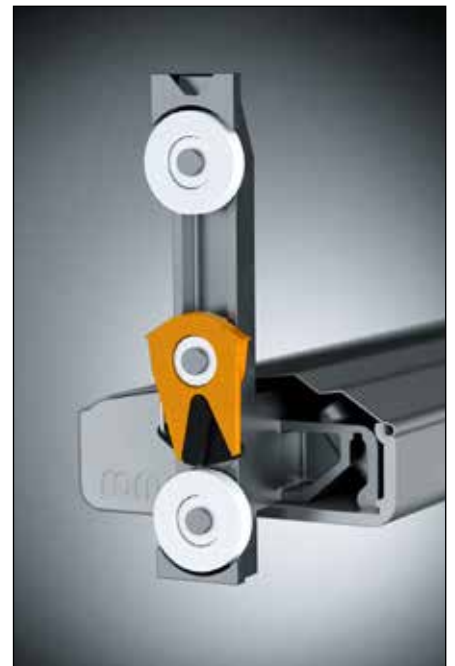
Integrierte Hochschiebehemmung der Endleiste

CDL ist nicht kombinierbar mit Tageslichttechnik (TLT) oder Seilführung.