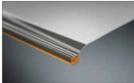
Minimierte Geräusentwicklung durch coextrudierten Lamellenkeder.