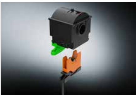
Einfachste Wartung der Aufzugsbänder durch patentierte ROMA-Bandspule