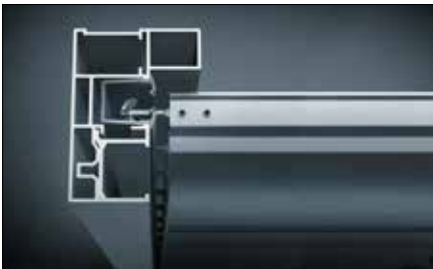
Keine seitlichen Einblicke durch speziell geformte Führungsschienen