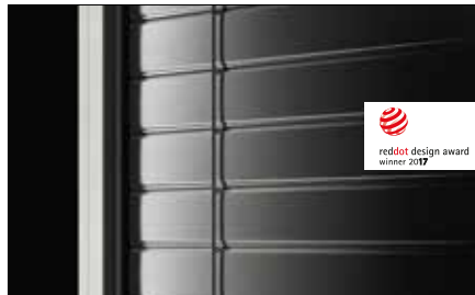
Keine von außen sichtbaren Stanzungen durch innovative Lamellenaufhängung