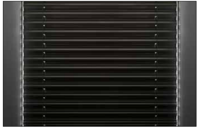
Vergleich Abdunklung im Innenraum (links CDL, rechts DBL): ROMA CDL erreicht viel bessere Abdunkelung