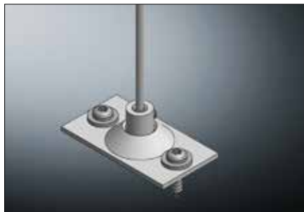
Perfekt integrierte Windsicherung durch innenliegendes Spannseil