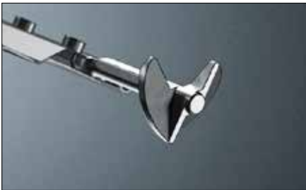
Höhere Windstabilität durch beidseitige Lamellenbolzen aus langlebigem Zink-Druckguss in Propellerform