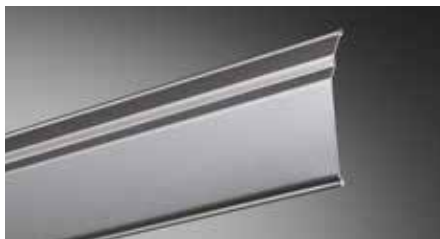
Comfort & Design Lamelle CDL