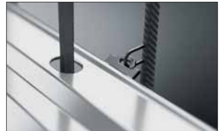
Minimierter Verschleiß durch kunststofffreie Raffstollenlamellen mit tiefgezogenen Lamellenstanzungen.