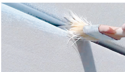
Herausquellende Klebspachtelmasse wird mit einem nassen Pinsel zu einer Hohlkehle geformt.