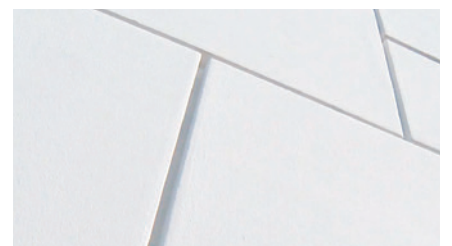
Danach kann die entsprechende Oberflächenfarbe auf Silikat-, Kunstharz-, bzw. Silikonbasis (z. B. Baunit PuraColor, Baunit StarColor) im Rollverfahren dünnsschichtig aufgetragen werden.