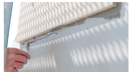
Die Plattenkanten werden mit normgerechtem Fassadenkleber versehen.