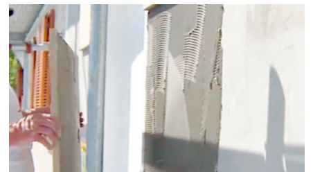
Auch der Untergrund wird vollflächig mit normgerechtem Fassadenkleber versehen.