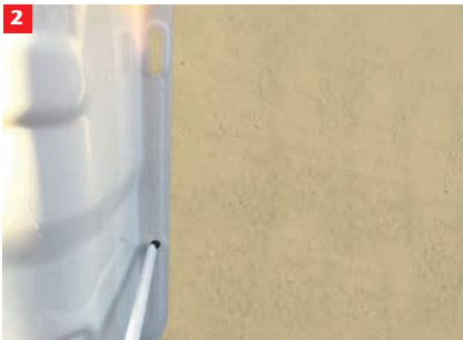
2 4 untere Befestigungspunkte anzeichnen