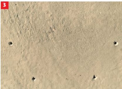
3 4 untere Befestigungspunkte anzeichnen und Löcher mit Durchmesser 10 mm bohren