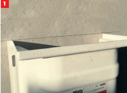
1 Oberkante Lüftungsschacht bestimmen