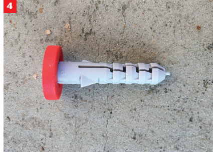
4 Distanzscheibe auf Dübel aufstecken