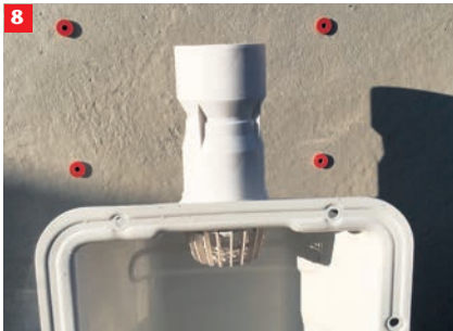
8 Entwässerungsanschluss oder Verschlussdeckel einschrauben