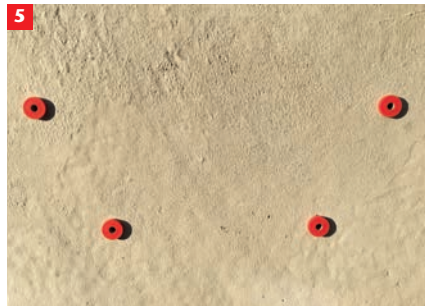
5 Dübel mit Distanzscheibe in Bohrungen stecken