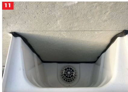
11 Schrauben fest anziehen. Dichtungsband muss von innen umlaufend zu sehen sein. Dichtungsband auf ca. 3 mm komprimieren