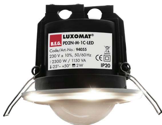
PD2N-M-1C-LED-DE Art.-Nr. 94055

Der bidirektionale Präsenzmelder mit einem Erfassungsbereich von 10m bietet neben der integrierten Tageslichtregelung eine Vielzahl von Einstellungsmöglichkeiten zur individuellen Anpassung an die örtlichen Begebenheiten.