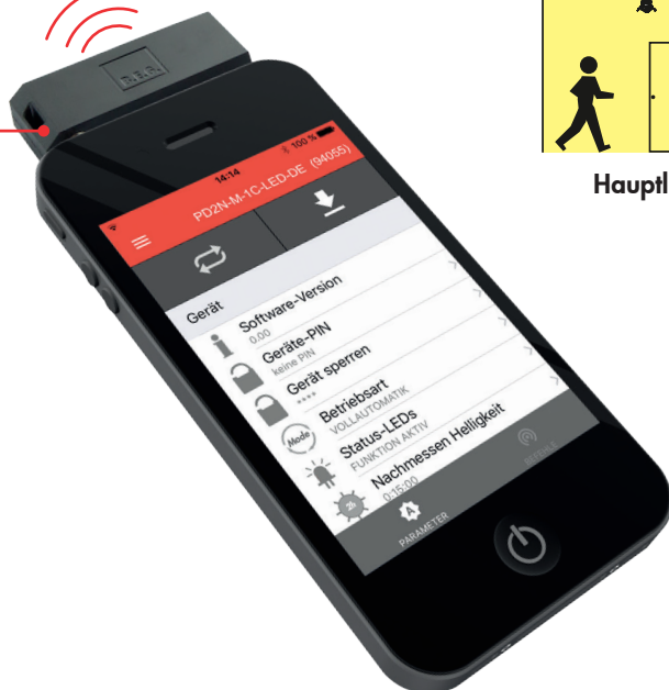
IR-Adapter für Smartphones Art.-Nr. 92726

Sämtliche Parameter können übersichtlich und bequem über die spezielle B.E.G. Fernbedienungs-App in Verbindung mit dem IR-Adapter für kompatible Smartphones ausgelesen und auf den für die Nutzung passenden Wert eingestellt werden.