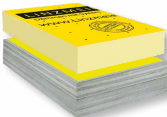
LINITHERM Dachbodenelement PGV oder PAL LINITHERM PE Dampfbremse 120 Betondecke