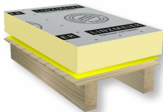
LINITHERM Dachbodenelement PAL oder PGV LINITHERM PE Dampfbremse 120 Holzbalkendecke

Die Dämmung der obersten Geschossdecke ist bei nicht nutzbaren Spitzböden die leichteste und preiswerteste Dämm-Maßnahme. Vor dem Verlegen den Dachboden mit der PE Dampfbremse 120 auslegen und die Stöße verkleben. Bei Betondecken kann die Folie entfallen. Nun die LINITHERM PAL bzw. LINITHERM PGV Universal-Dämmplatten in einer Ecke beginnend einfach stoßversetzt auflegen.