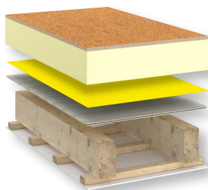
LINITHERM PHW LINITHERM PE Dampfbremse 120 Holzschalung Balken Raumseitige Bekleidung