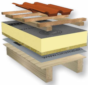
Altbausanierung oder Neubau LINITHERM PAL 2UM Aufsparrendämmung mit sichtbaren Sparren und Holzschalung