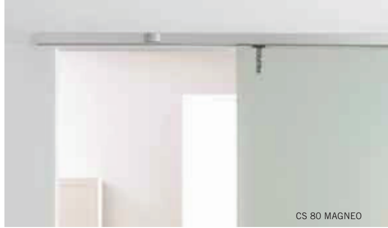
CS 80 MAGNEO