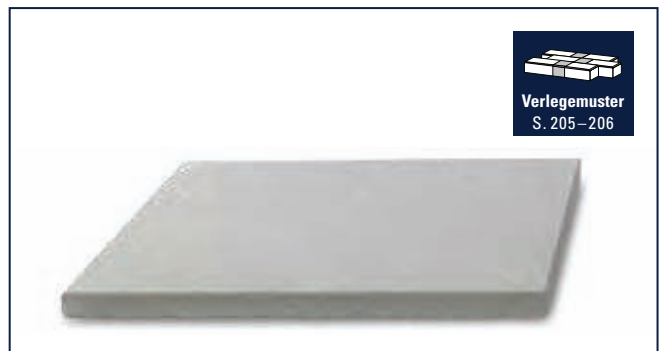
MultiPoller MultiBlock S. 320–323