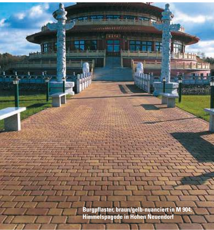
Burgpflaster, braun/gelb-nuanciert in M 904, Himmelpagode in Hohen Neuendorf

● geeignet ● bedingt geeignet ● nicht geeignet