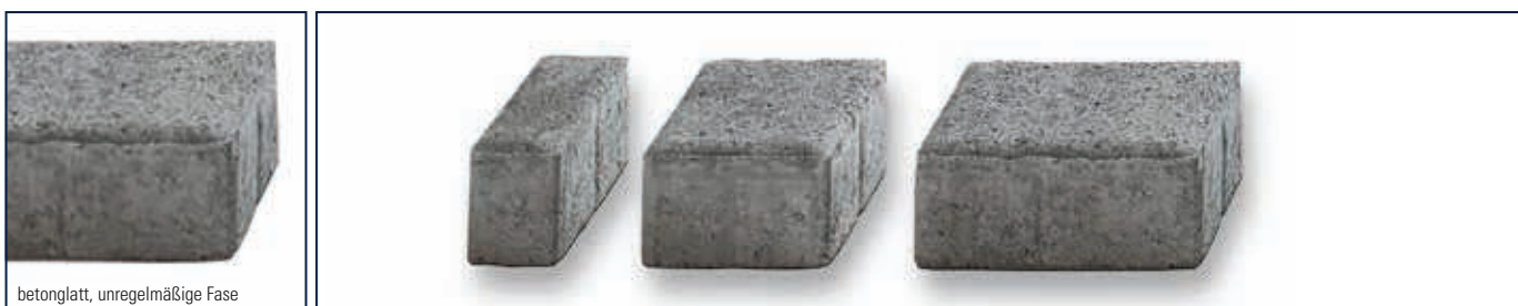
betonglatt, unregelmäßige Fäse

Burgpflaster ist nur in den Lieferregionen Nord und Ost erhältlich.