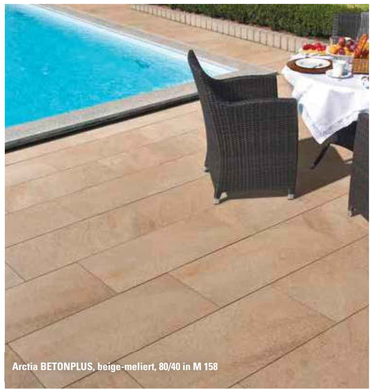
Arctia BETONPLUS, beige-meliert, 80/40 in M 158