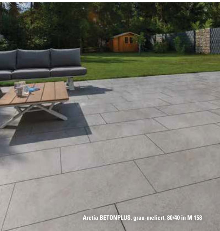
Arctia BETONPLUS, grau-meliert, 80/40 in M 158