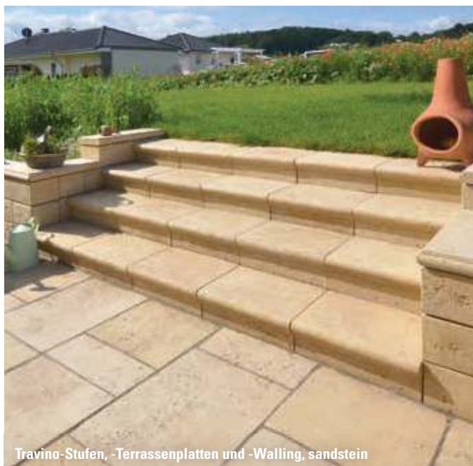
Travino-Stufen, -Terrassenplatten und -Walling, sandstein