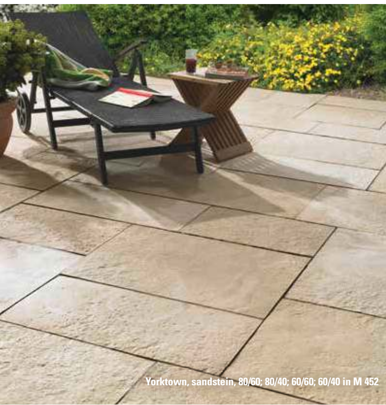
Yorktown, sandstein, 80/60; 80/40; 60/60; 60/40 in M 452

1) Optional als kombinierte Liefereinheit für wilden Verband nach Muster M 452, Paket 5,2 m 2 lieferbar