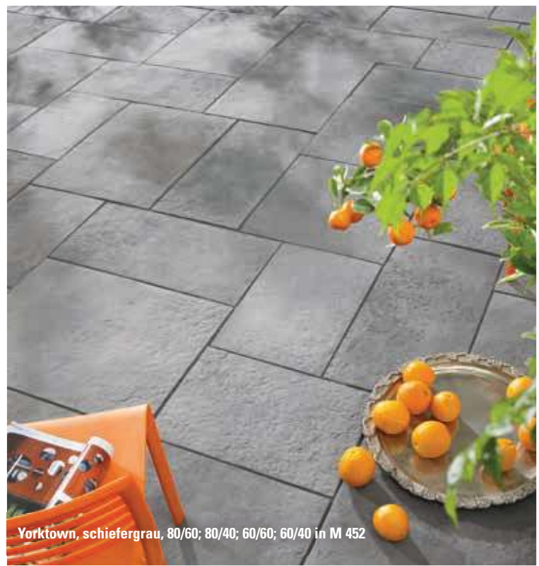
Yorktown, schiefergrau, 80/60; 80/40; 60/60; 60/40 in M 452