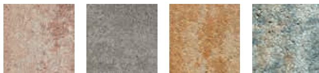
Nebraska Kies grau/anthrazit-nuanciert Sunset muschelkalk-nuanciert

Weitere Farben und Oberflächen auf Anfrage.