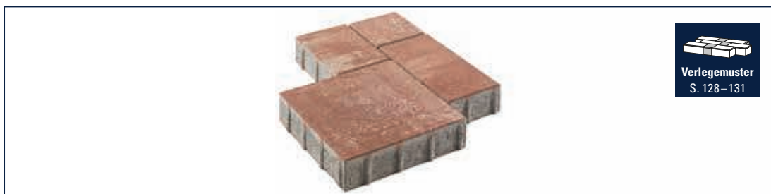
Verlegemuster S. 128–131