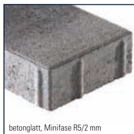
betonglatt, Minifase R5/2 mm