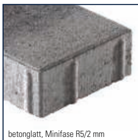
betonglatt, Minifase R5/2 mm