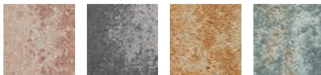
Nebraska Kies a) grau/anthrazit-nuanciert Sunset a) muschelkalk-nuanciert

a) Nur als kombinierte Lage für wilden Verband.