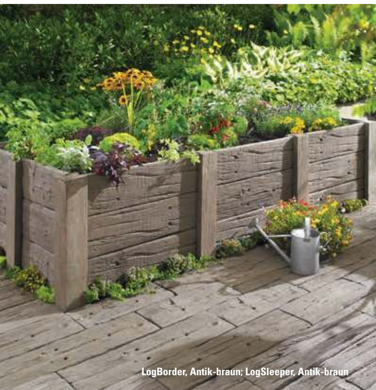
LogBorder, Antik-braun; LogSleeper, Antik-braun

* je 1,46 Stück bei Verwendung von 60er LogSleeper-Platten und je 1,01 Stück bei Verwendung von 90er LogSleeper-Platten. Es ist zu berücksichtigen, dass grundsätzlich ein Pfosten für den Abschluss zusätzlich bestellt werden muss.