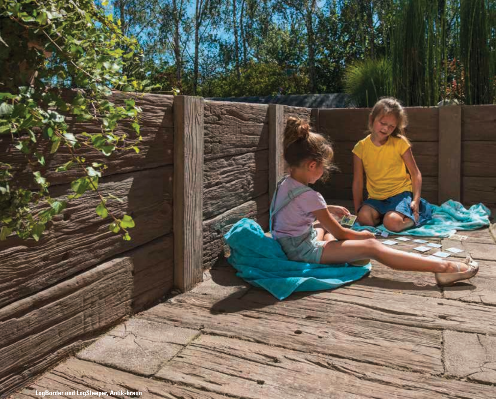
LogBorder und LogSleeper, Antik-braun

Zusammen mit LogBorder und LogSleeper lassen sich Hochbeete oder niedrige Einfassungen erstellen. Der Einbau der LogBorder erfolgt wie bei Palisaden (siehe Einbauempfehlungen Palisaden). Die Ausfachung erfolgt mit den 90 cm oder den 60 cm langen LogSleepern.