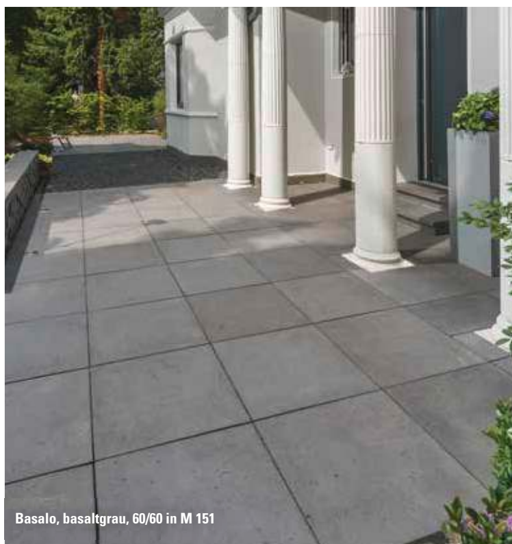
Basalo, basaltgrau, 60/60 in M 151