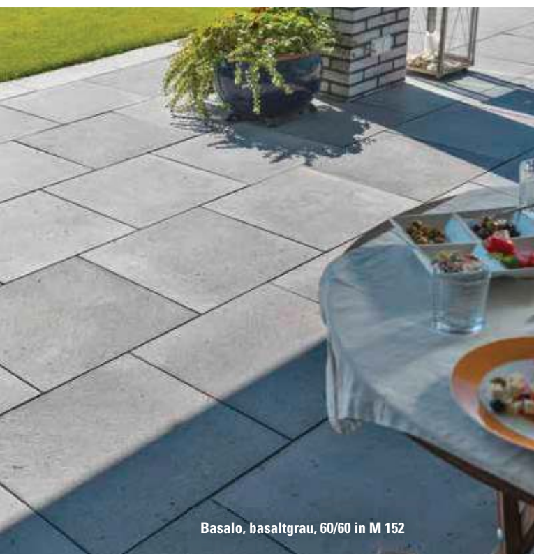
Basalo, basaltgrau, 60/60 in M 152