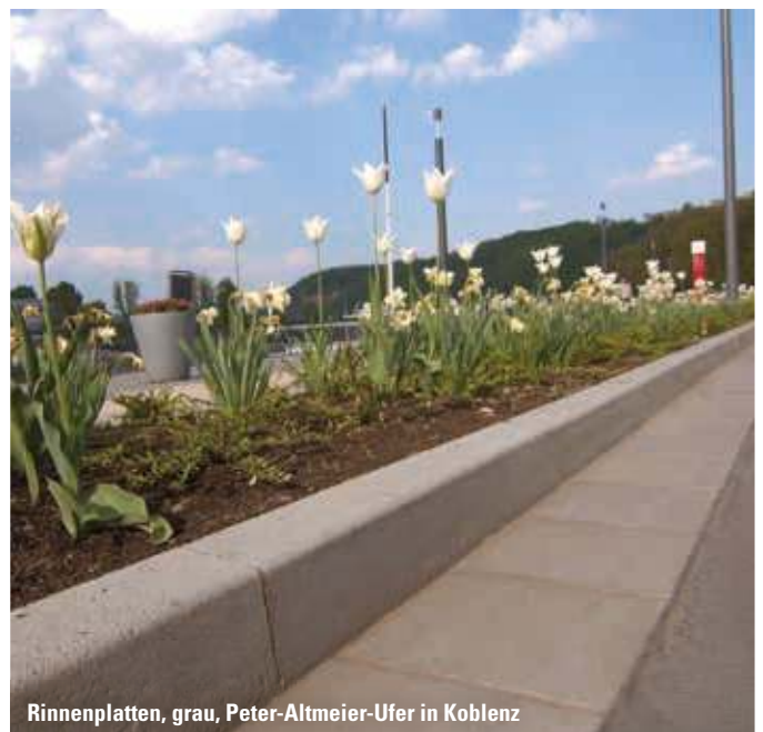
Rinnenplatten, grau, Peter-Altmeier-Ufer in Koblenz