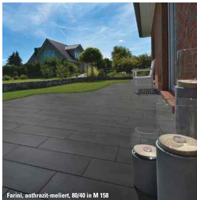
Farini, anthrazit-meliert, 80/40 in M 158