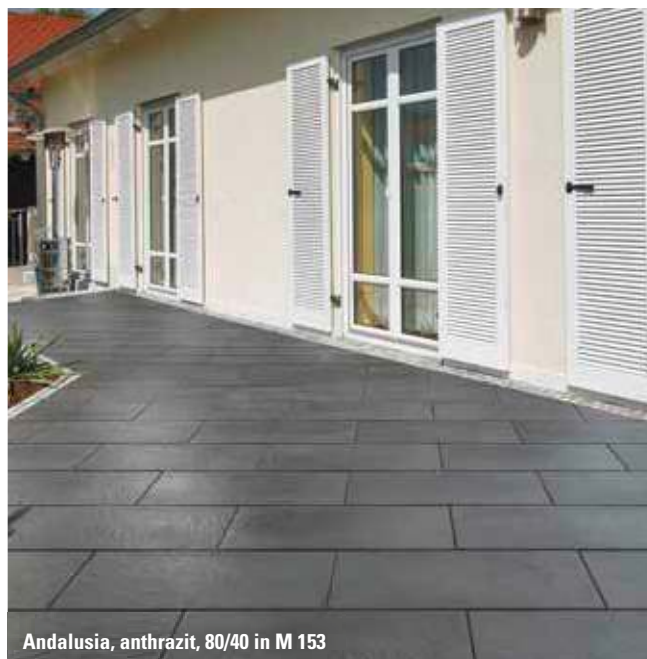
Andalusia, anthrazit, 80/40 in M 153