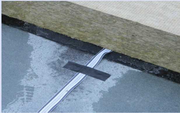
dm-Sensor in einem Warmdachaufbau