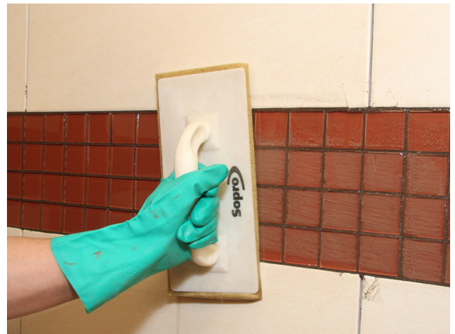
Abwaschen des Glasmosaiks nach ausreichender Standzeit des Fugenmörtels.