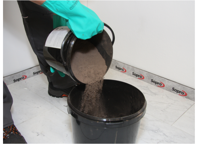
Sopro DF 10 zudosieren und maschinell anrühren.