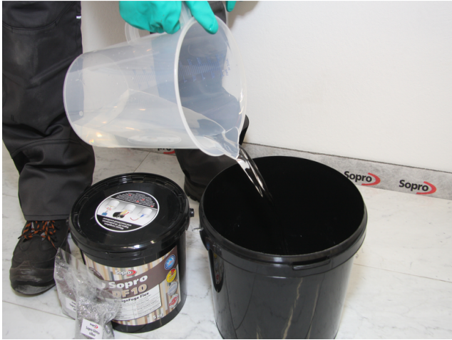
In einen sauberen Eimer sauberes Wasser gemäß Tabelle vorgeben.