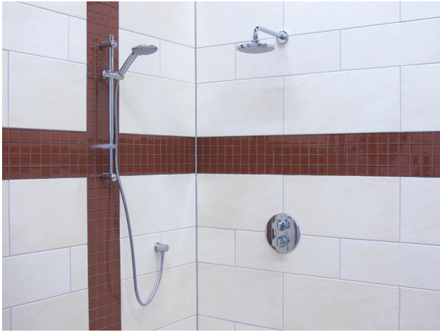
Farbbrillante Fugenfläche im Badezimmer.