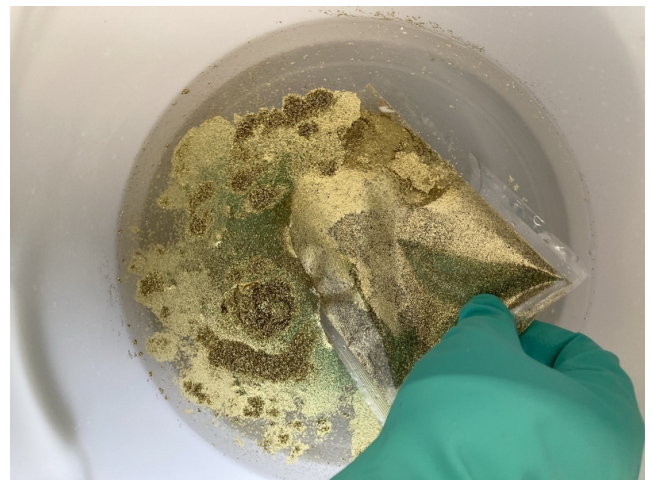
Die Entleerung des Glitters erfolgt im Wasser.