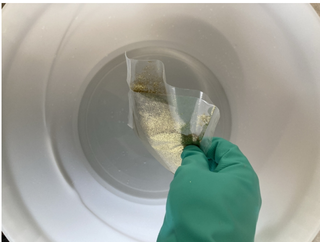
Nach vorsichtigem Aufschneiden des Beutels wird der Glitter in das Anmachwasser gegeben.