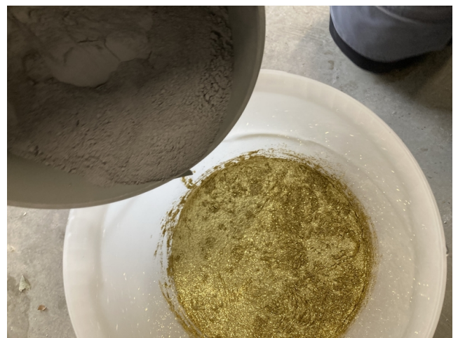
Der Fugenmörtel wird dem mit Glitter versetzten Anmachwasser zugegeben.