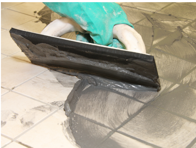
Einfugen von Sopro DF 10 in Feinsteinzeugfliesen.