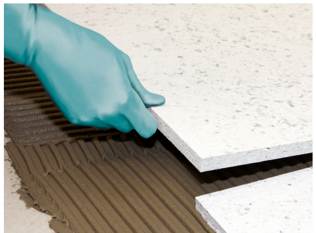
Sopro FliesenDämmPlatten lassen sich leicht verlegen, da sie nur direkt aneinander gestoßen werden müssen.