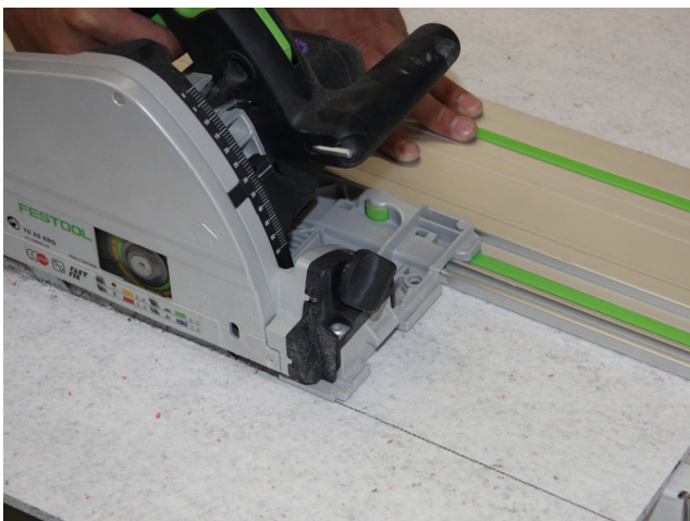
Für das Zuschneiden der Sopro FliesenDämmPlatte ist z. B. eine Handkreissäge zu verwenden.