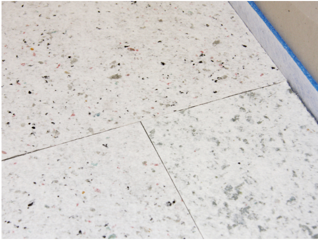
Plattenstöße nebeneinanderliegender Reihen werden versetzt verlegt.