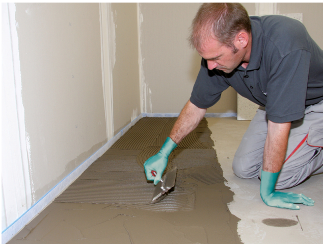
Nach Trocknung der Spachtelmasse wird auf den planebenen Untergrund z. B. Sopro's No. 1 Flexkleber aufgetragen.