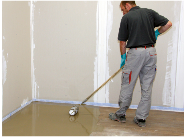
Mit einer Stachelwalze wird die aufgebraute Spachtelmasse verteilt und verdichtet, um eine planebene Oberfläche zu erhalten.