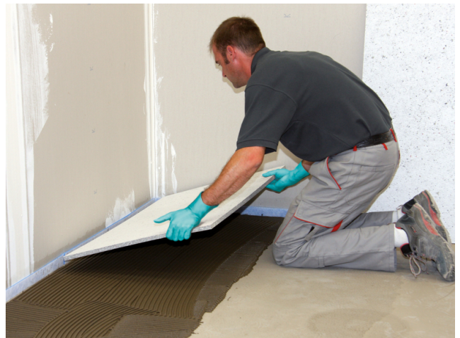
Das Einlegen der Sopro FliesenDämmPlatte erfolgt vollsatt in das frische Mörtelbett.