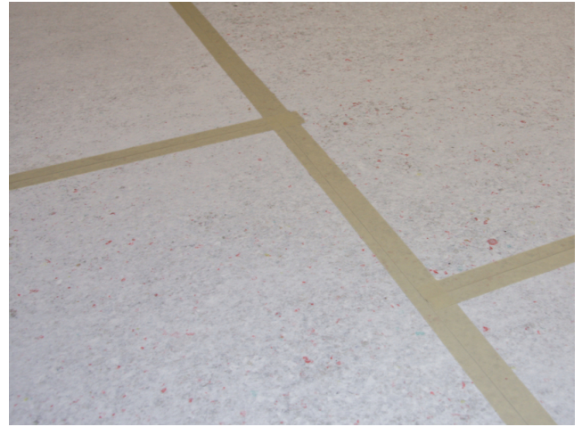
Zur Vermeidung von Mörtelbrücken (Körperschallbrücken) werden die Stöße der Platten mit Klebeband überklebt.