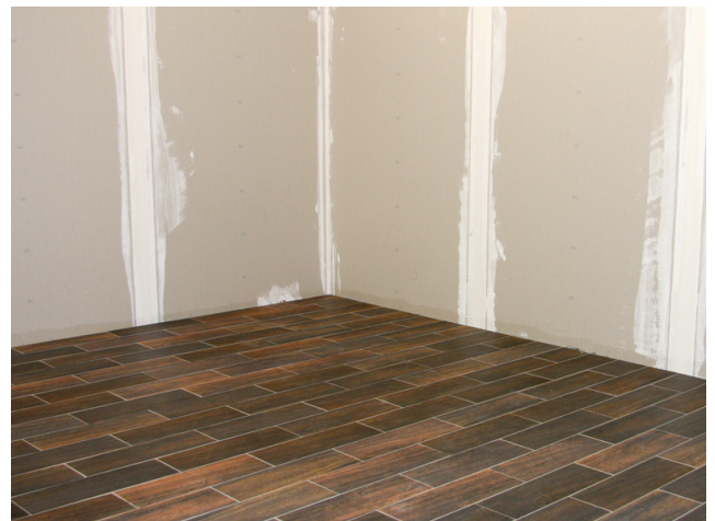
Entkoppelter, frisch verlegter und verfugter keramischer Belag auf einem Holzuntergrund.