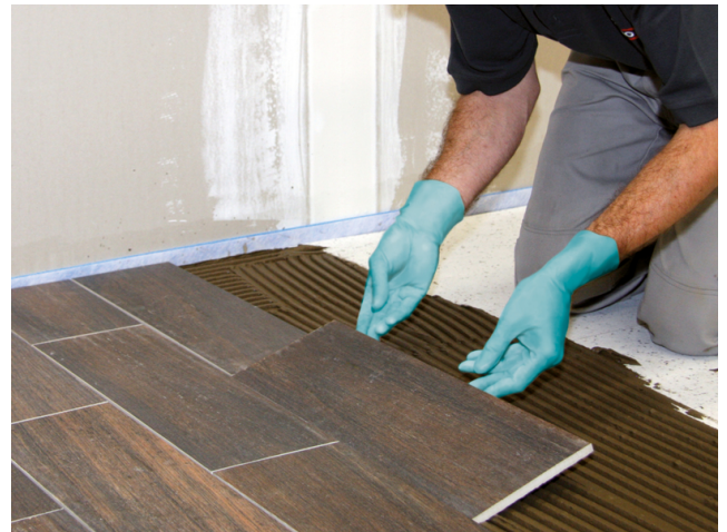
Verlegen der keramischen Fliesen in das vorbereitete frische Mörtelbett.