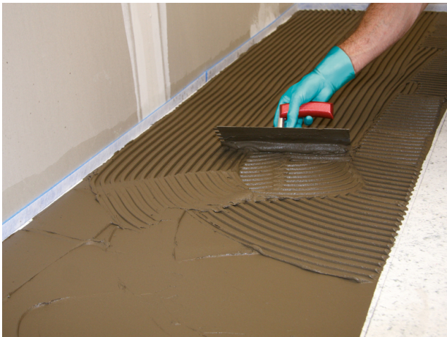
Auftrag von z. B. Sopro's No. 1 Flexkleber mit einer Zahnkelle auf die Sopro FliesenDämmPlatte für die anschließende Verlegung des keramischen Belages.