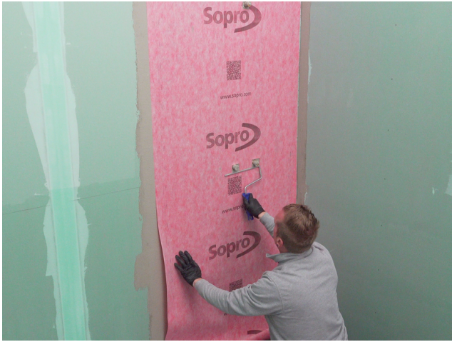
Die passgenau zugeschnittene Sopro AEB® Abdichtungs- und Entkopplungsbahn in die frische Klebeschicht einlegen und von der Mitte her fest andrücken.