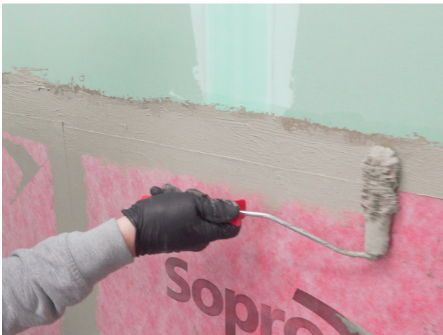
Die Abschlüsse der Sopro AEB® Abdichtungs- und Entkopplungsbahn mit Sopro Fixier- & DichtKleber oder Sopro DichtSchlämme Flex RS überarbeiten.