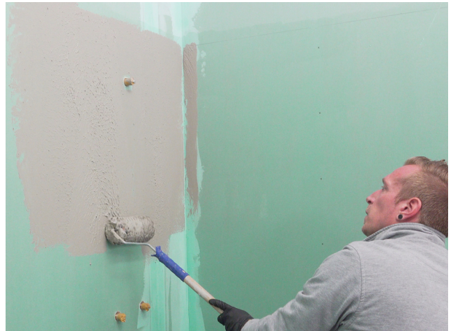
Sopro Fixier- & DichtKleber oder Sopro DichtSchlämme Flex RS vollflächig aufrollen.