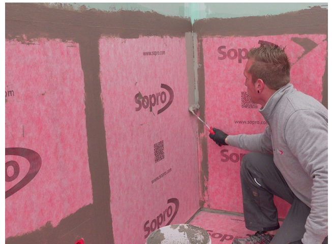
Stoßbereiche der Sopro AEB® Abdichtungs- und Entkopplungsbahn werden mit Sopro AEB® Dichtband Flex (mit Falz) überarbeitet.