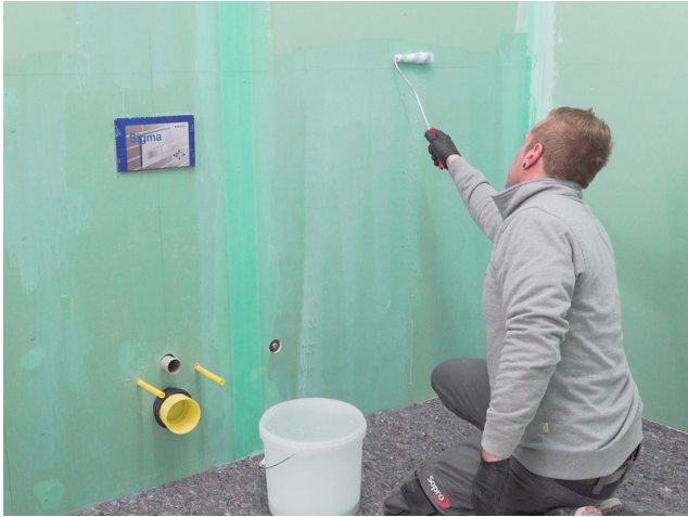
Saugende Untergründe mit Sopro Grundierung vorbehandeln.