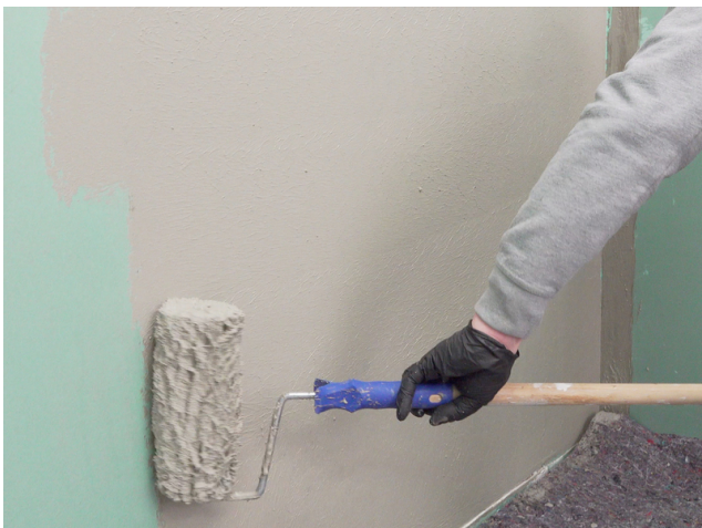
Für ein gleichmäßig deckendes Ergebnis Sopro Fixier- & DichtKleber oder Sopro DichtSchlämme Flex RS im Kreuzgang auftragen.