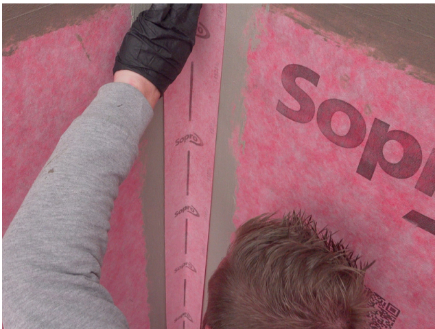
Das passgenau zugeschnittene Sopro AEB® Dichtband Flex (mit Falz) ohne Schlaufenbildung in die frische Klebeschicht einlegen und fest andrücken.