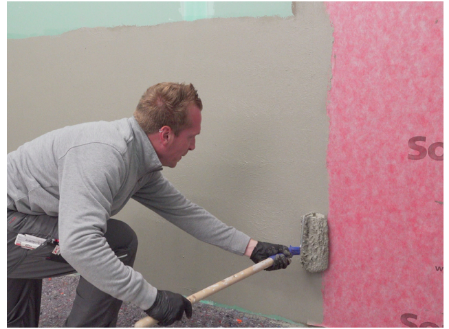
Die Überlappungen der Sopro Abdichtungs- und Entkopplungsbahn ca. 5 cm mit Sopro Fixier- & DichtKleber oder Sopro DichtSchlämme Flex RS überarbeiten.