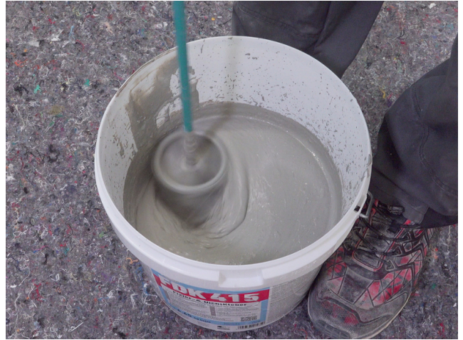
FDK 415: Flüssigkomponente vorgeben und mit Pulverkomponente maschinell anmischen. Alternativ: DSF RS im vorgegebenen Verhältnis mit Wasser anrühren.