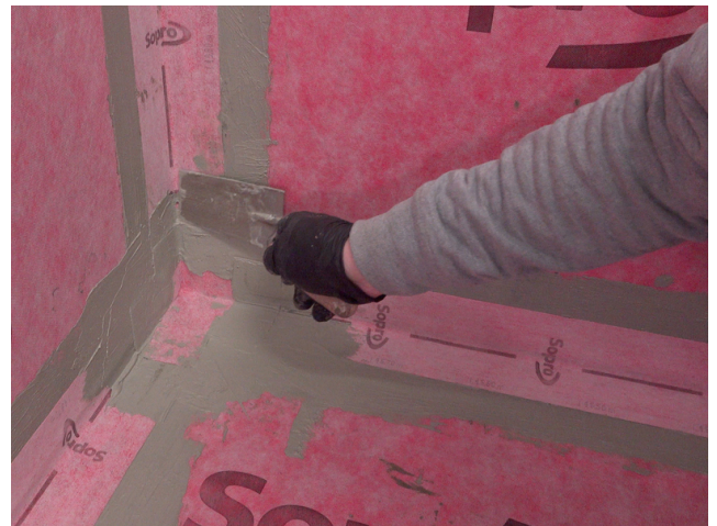
Abschlüsse des AEB® Dichtband Flex (mit Falz) werden im Anschluss mit Sopro Fixier- & DichtKleber oder Sopro DichtSchlämme Flex RS überarbeitet.