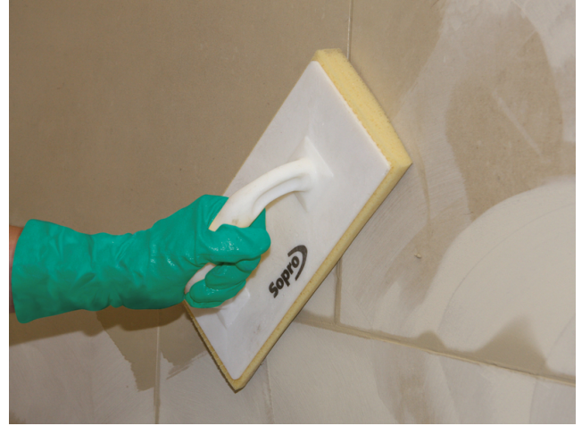
Abwaschen des Fliesenbelages nach ausreichender Standzeit der eingefugten Sopro Fugenmasse.