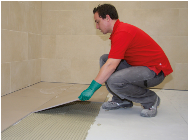
Großformatiges Feinsteinzeug einlegen und ausrichten. Fugennetz