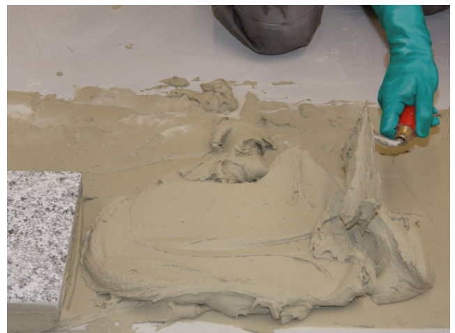
Sopro FKMXL ist für höhere Mörtelschichtstärken bis 10 mm auch mit der Kelle verarbeitbar.