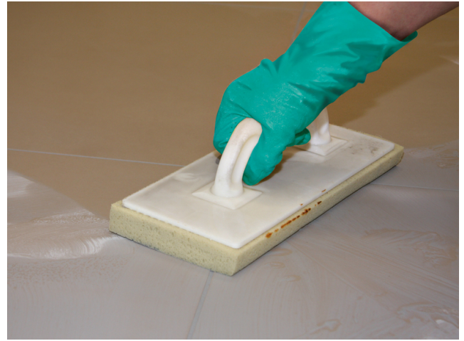
Abwaschen des Fliesenbelages nach ausreichender Standzeit der eingefugten Sopro Fugenmasse.