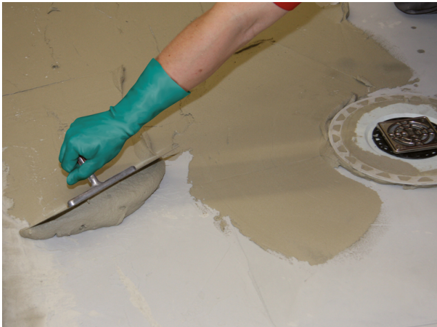
Für das Aufbringen einer partiellen Gefällespachtelung ist zuvor eine Kontaktschicht mit Sopro FKM XL aufzuziehen.