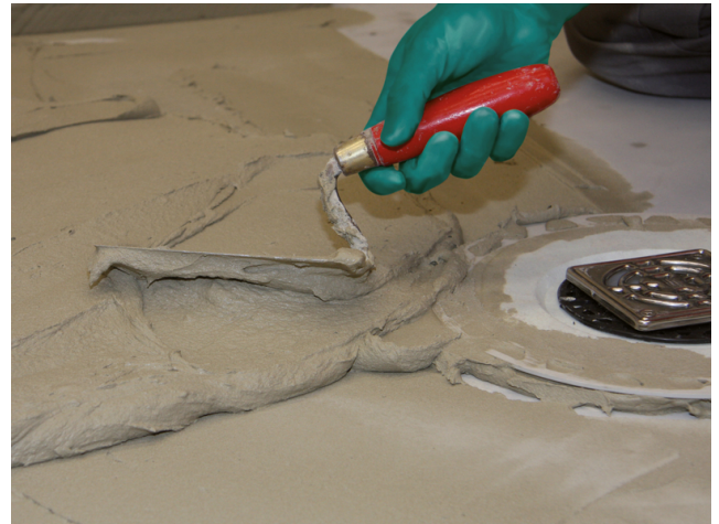
Danach Sopro FKM XL in Spachtelkonsistenz auf den Untergrund aufbringen...