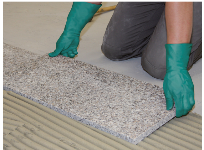
Natursteinplatte einlegen und ausrichten. Fugennetz vor der Erhärtung auskratzen.