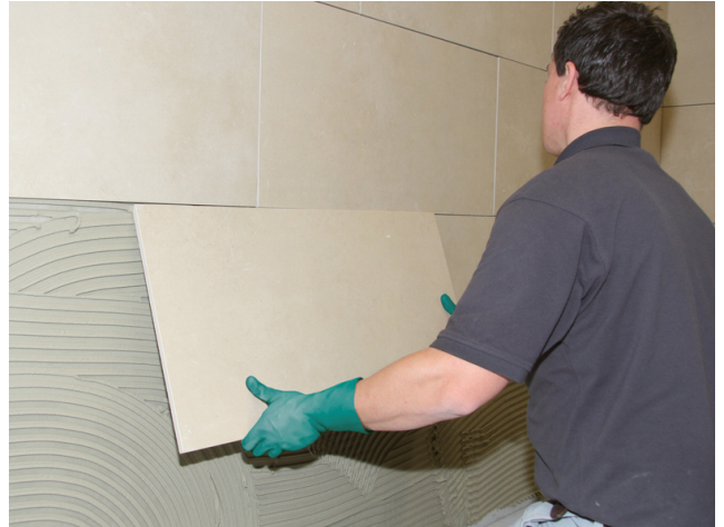
Großformatiges Feinsteinzeug einlegen und ausrichten. Fugennetz vor der Erhärtung auskratzen.