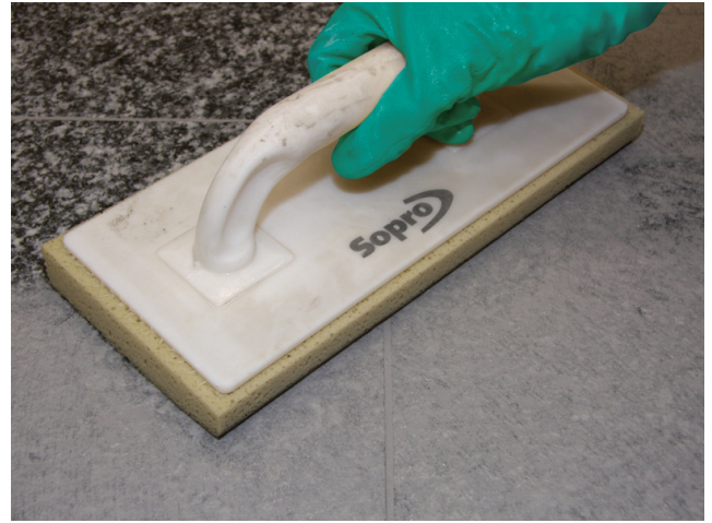
Abwaschen des Natursteinbelages nach ausreichender Standzeit der eingefugten Sopro Fugenmasse.