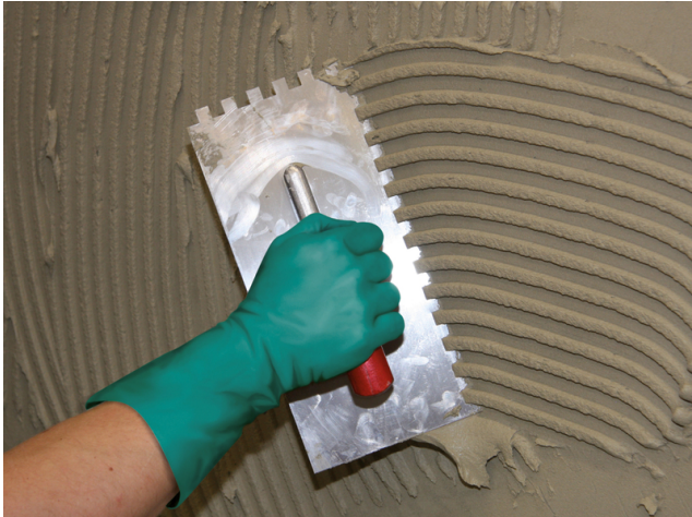
Aufziehen des Kammbettes in Wandkonsistenz auf die vorbereitete Kontaktschicht.