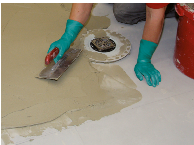
... und das Gefälle bis zu einer Spachteldicke von 10 mm für die nachfolgende Verbundabdichtung vorbereiten.