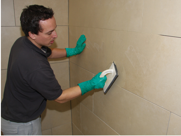
Verfugung der Fläche mit einer Sopro Fugenmasse (z.B. Sopro DF 10 DesignFuge Flex, Sopro Brillant Perlfuge)