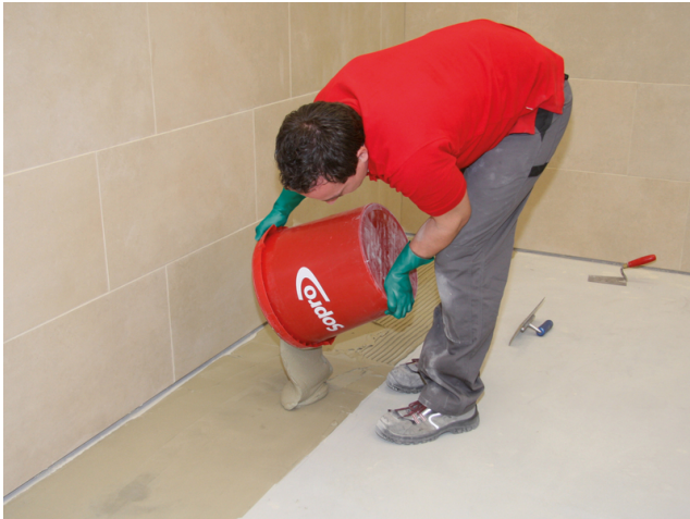
Ausgießen des FKM XL in Fließbettkonsistenz auf den vorbereiteten Untergrund.