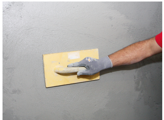
... oder einer Holzscheibe nachgerieben werden, um so besonders glatte Oberflächen zu erzielen.