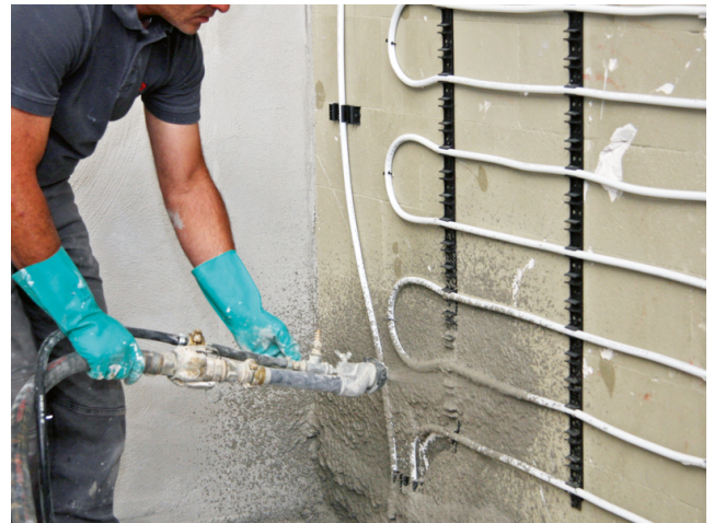
Sopro RAP 2® kann auch maschinell im Spritzverfahren aufgebracht werden – wie hier zur Einbettung einer Wandheizung (Kermi x-net c21).