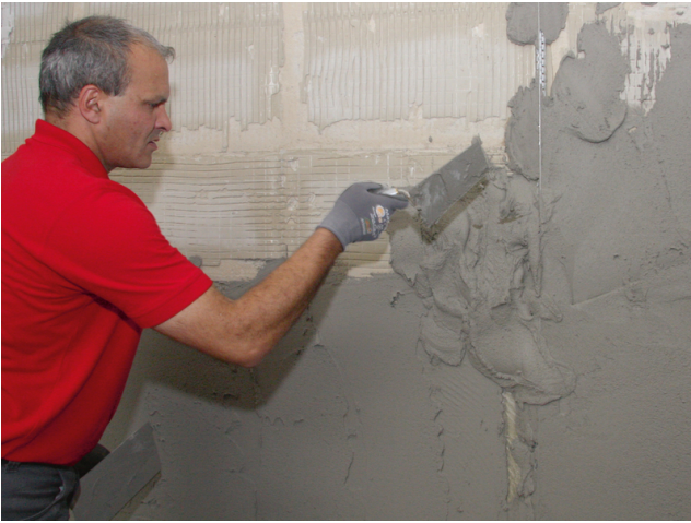
Die Fläche zwischen den Putzschienen durch Anwerfen von Sopro RAP 2® mit Putz füllen.