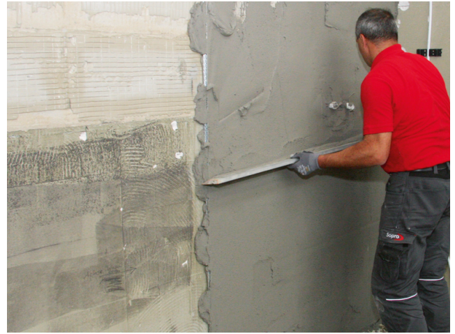
Anschließend den Putz mit einer Latte über die Putzschienen sauber von unten nach oben abziehen.