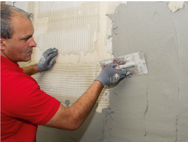
Alternativ kann Sopro RAP 2® mit der Glättkelle aufgebracht werden.