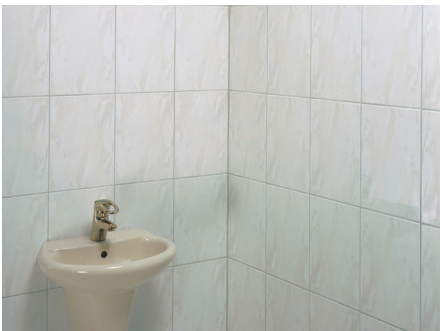
Fertig gefliester und verfugter Wandbereich.