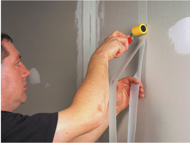
Sopro Fixier-Band wird auf der mit Sopro Grundierung vorbereiteten Fläche angebracht.