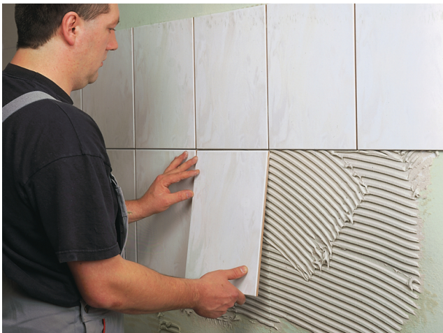
Die Fliesen werden in herkömmlicher Technik mit einem Sopro Fliesen-Kleber angesetzt.