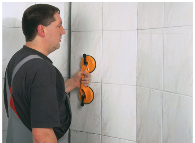
Nach Entfernen der Sanitäröbjekte und dem Aufschneiden der Silikonfugen wird der Fliesenbelag mittels eines Sauggriffes aufgenommen.