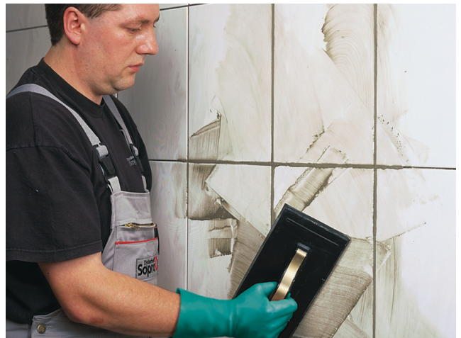
Anschließend wird der Belag mit einem Sopro Fugenmörtel verfugt.