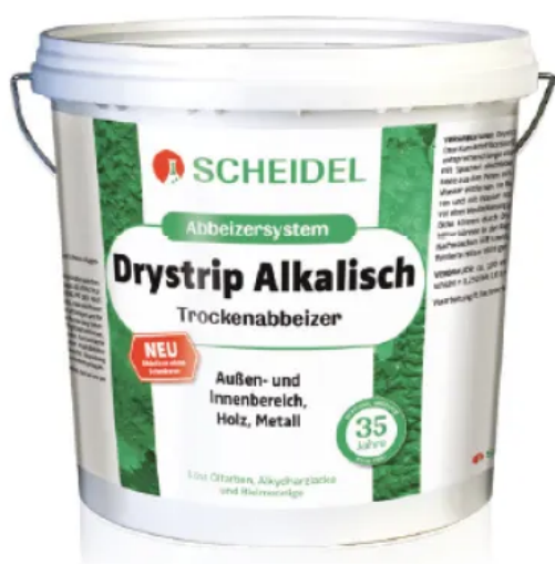
Drystrip Alkalisch Trockenabbeizer