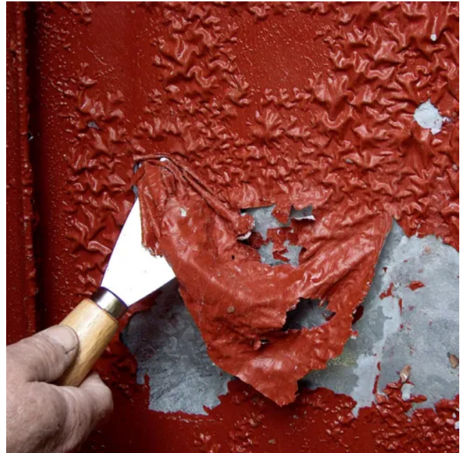
Blitz Schnellentlacker für Holz, Metall, mineralische Untergründe.