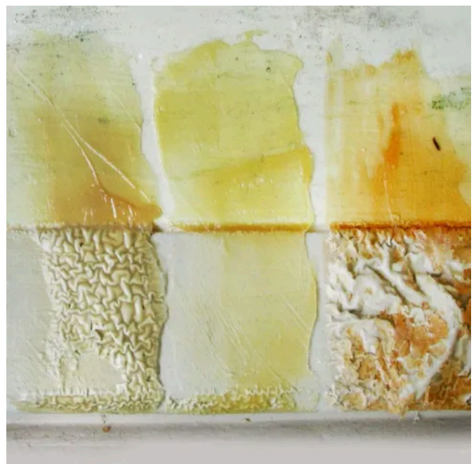
Systemtasche Abbeizer Testset für den einfachen Vortest bei Abbeizarbeiten