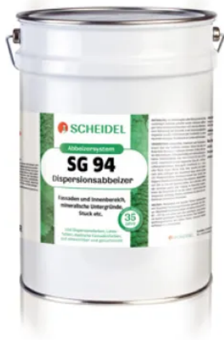
SG 94 Dispersionsabbeizer