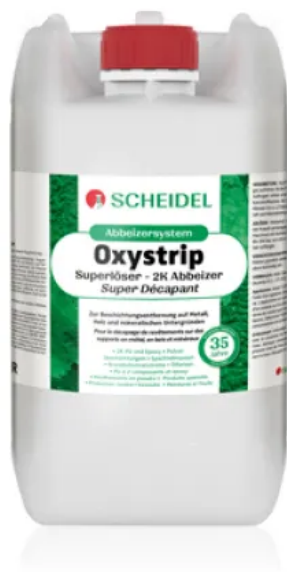
Oxystrip Superlöser 2K Abbeizer

Oxystrip Superlöser 2K Abbeizer für 2K-Beschichtungen und Lacke