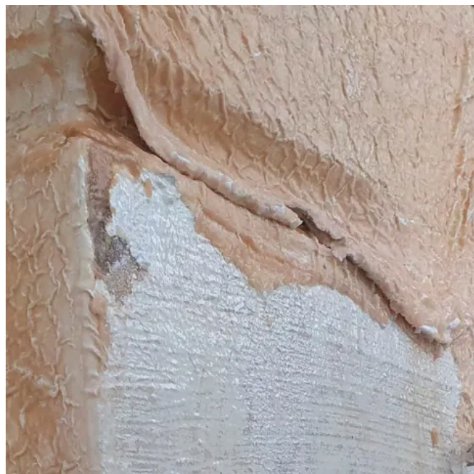
Asur Allround Abbeizer für Fassaden und Innenwände, Holz und Metall.