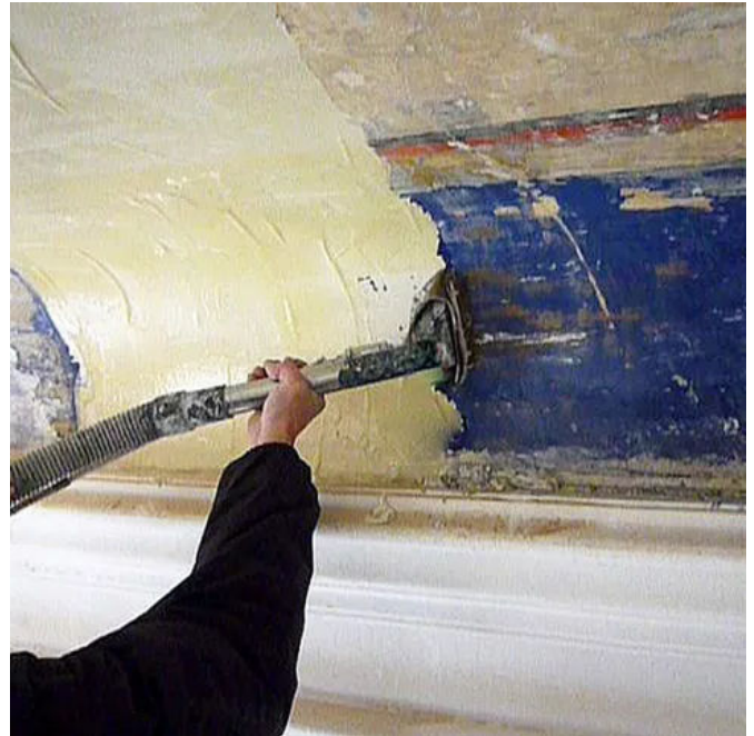
SG 94 Dispersionsabbeizer für mineralische Fassaden, Putz, Stuck.