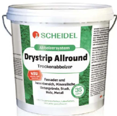
Drystrip Allround Trockenabbeizer