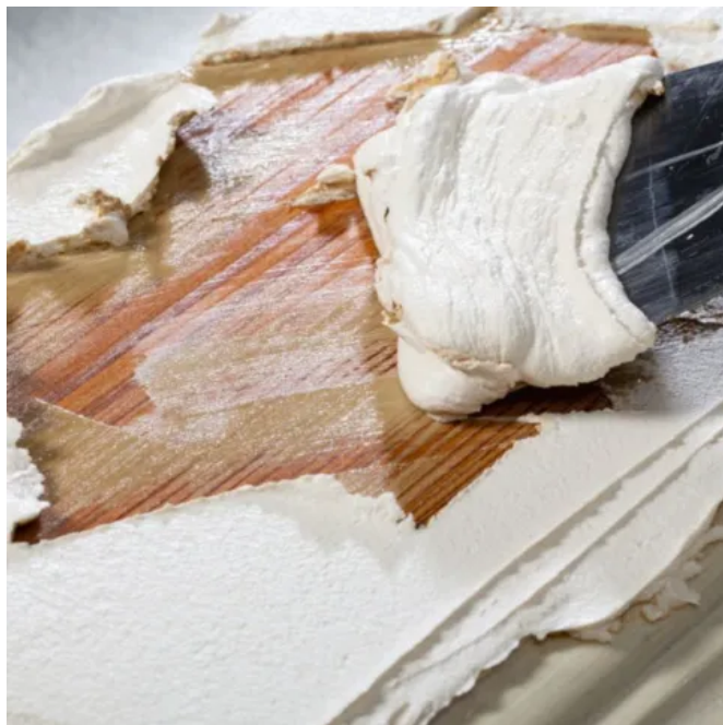
Drystrip Trockenabbeizer für Außen- und Innenbereiche, Holz, Metall.