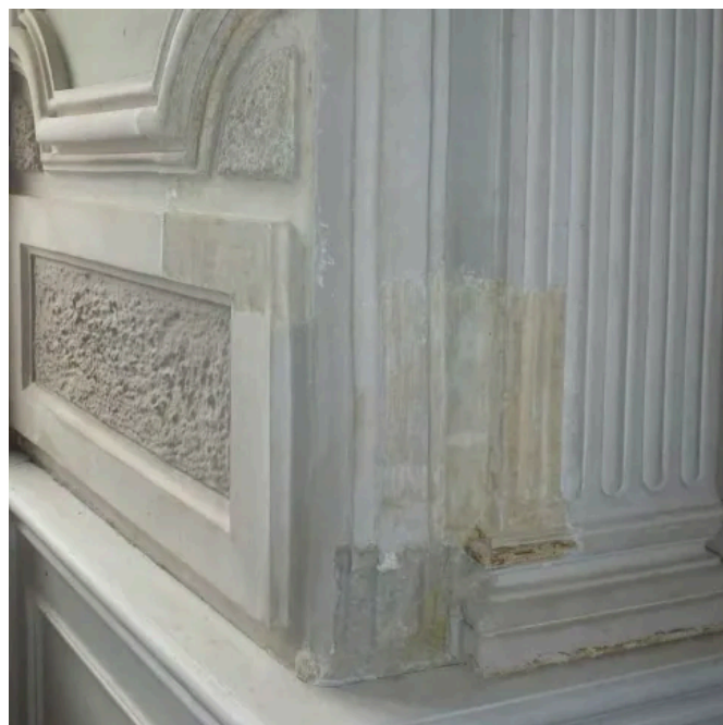
Drystrip Allround Trockenabbeizer für Fassaden und Innenbereich, mineralische Untergründe, Stuck, Holz, Metall.