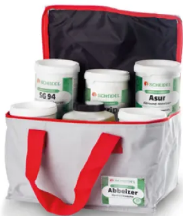
Systemtasche Abbeizer Testset

Mit Hilfe von Testflächen lässt sich der optimale Abbeizer für das Objekt ermitteln. Nach Aufziehen des Abbeizers ist der Lösevorgang in definierten Zeitabständen zu beobachten. Je nach Art und Stärke der zu entfernenden Beschichtung und der Umgebungstemperatur werden die Schichten unterschiedlich schnell gelöst.