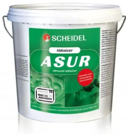
Asur Allround Abbeizer