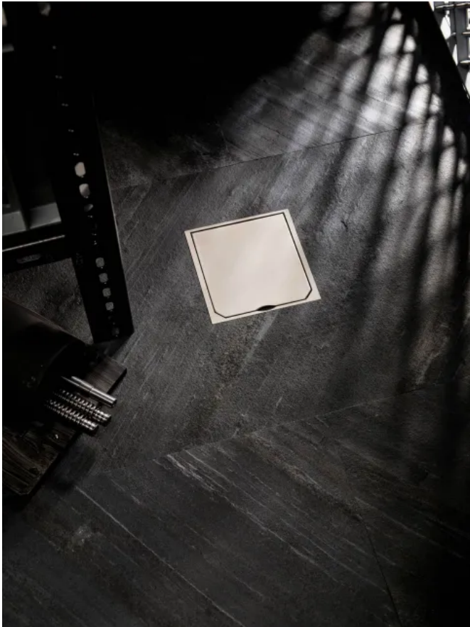
ABL BOWAmaxi Bodensteckdose mit Klappdeckel

Aus der Serie eMobility und Connectivity von ABL