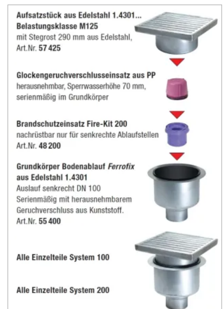
Beispiel für die Kombination im Baukastensystem

Durch das übergreifende Baukastensystem lassen sich passende Bauteile einfach kombinieren und damit spezielle Sonderlösungen realisieren. Beispielsweise kann ein Kunststoff-Ablaufkörper mit einem Zwischenstück und Aufsatzstück aus Edelstahl komplettiert werden.