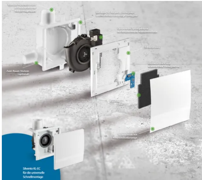
Abluftsystem Silvento ec

Individuell konfigurierbares und flexibles Abluftsystem. Über den Einsatz unterschiedlicher Steuerplatinen lassen sich verschiedene Funktionen für den spezifischen Bedarf auswählen: