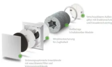
Außenwand-Luftdurchlass ALD: für alle Anwendungen, insbesondere für den Einsatz in Wohn- und Schlafräumen

Die Außenwand-Luftdurchlässe ALD, ALD-SV und ALD-S dienen als passive Nachströmung für Wohn- und Schlafräume. Sie werden vor allem in Kombination mit LUNOS-Abluftgeräten der Baureihe Silvento genutzt. Durch die Ablüfter in den Funktionsräumen, wie Bad und Küche, wird ein stetiger Unterdruck gebildet, der über die Außenwand-Luftdurchlässe Frischluft in das Haus transportiert. Bei normgerechter Planung kann so eine nutzerunabhängige Lüftung nach DIN 1946-6 sichergestellt werden.