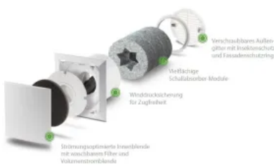
Außenwand-Luftdurchlass ALD: für alle Anwendungen, insbesondere für den Einsatz in Wohn- und Schlafräumen

Die Außenwand-Luftdurchlässe ALD, ALD-SV und ALD-S dienen als passive Nachströmung für Wohn- und Schlafräume. Sie werden vor allem in Kombination mit LUNOS-Abluftgeräten der Baureihe Silvento genutzt. Durch die Ablüfter in den Funktionsräumen, wie Bad und Küche, wird ein stetiger Unterdruck gebildet, der über die Außenwand-Luftdurchlässe Frischluft in das Haus transportiert. Bei normgerechter Planung kann so eine nutzerunabhängige Lüftung nach DIN 1946-6 sichergestellt werden.