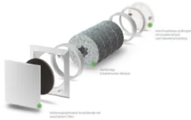
Außenwand-Luftdurchlass, ALD-S: für hohe Schallschutzanforderungen