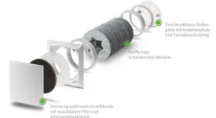
Außenwand-Luftdurchlass ALD-SV: für hohe Volumenströme bei erhöhtem Schallschutz