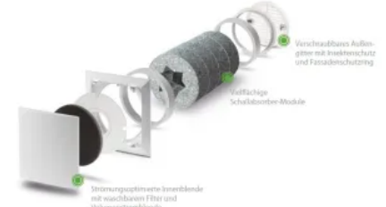
Außenwand-Luftdurchlass ALD-SV: für hohe Volumenströme bei erhöhtem Schallschutz