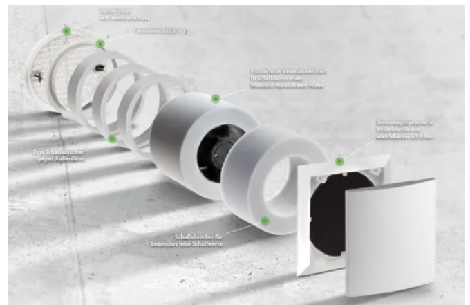
Axialer Abluftventilator AB 30/60