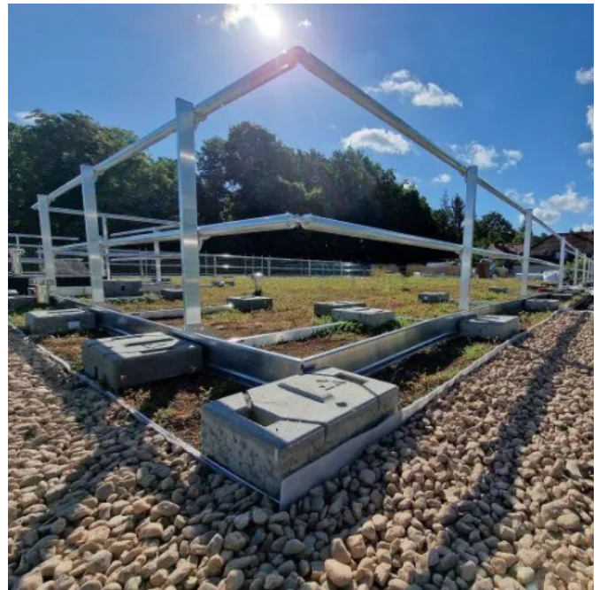
SAFETY SYSTEM GUARD Seitenschutzsystem

Das GUARD Seitenschutzsystem kann entsprechend den Kriterien der DIN EN 62305-3 als natürlicher Bestandteil der Ableitung einer Blitzschutzanlage eingesetzt werden. Voraussetzung dafür ist die Verwendung der entsprechenden Erdungsrohrschellen und Trennmuffen.