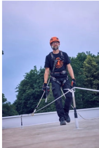
Absturzsicherungssystem SKYLINE 2.0