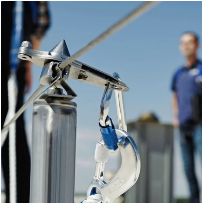
SEKURANT®VARIO LINE überfahrbar, mit Läuferelement

SEKURANT®VARIO LINE ist ein ständig nutzbarer, variabler Anseilschutz zur Befestigung der persönlichen Schutzausrüstung gegen Absturz. Durch definierte Verformung im Absturzfall entsteht eine minimale Krafterleitung in das System und den Nutzer. Die Fertigung der Absturzsicherung SEKURANT VARIO LINE entspricht den Bestimmungen der EN 1090-1:2012-03, Ausführung von Stahltragwerken und Aluminiumtragwerken (Konformitätsnachweisverfahren für tragende Bauteile). Bauaufsichtlich zugelassen mit DIBt-Zulassung Nr. Z-14.9-811 Die Leistungserklärung wird nach der Bauproduktenverordnung EU 305/2011 erbracht. Der bautechnische Nachweis für die Befestigungen, auf den in der Bauartenübersicht genannten Untergründen, kann erbracht werden.