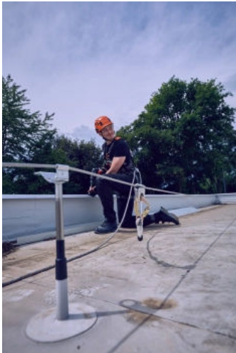
Absturzsicherungssystem SKYLINE 2.0

Aus der Serie Absturzsicherungssysteme an Gebäuden von SKYLOTEC