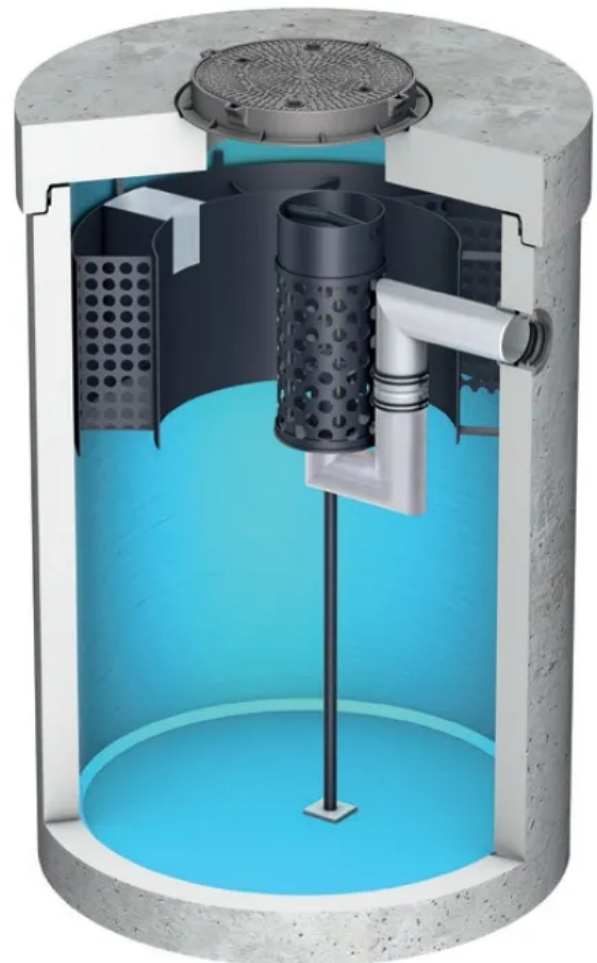
Mit filterloser Koaleszenzeinheit (Beton) Oleosmart