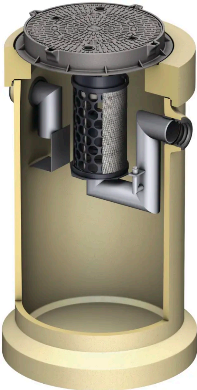
Mit Koaleszenzeinheit (Polymerbeton) Oleopator Pro

Aus der Serie Gewässerschutz: Abscheider und Pumpstationen für den Erdbau von ACO