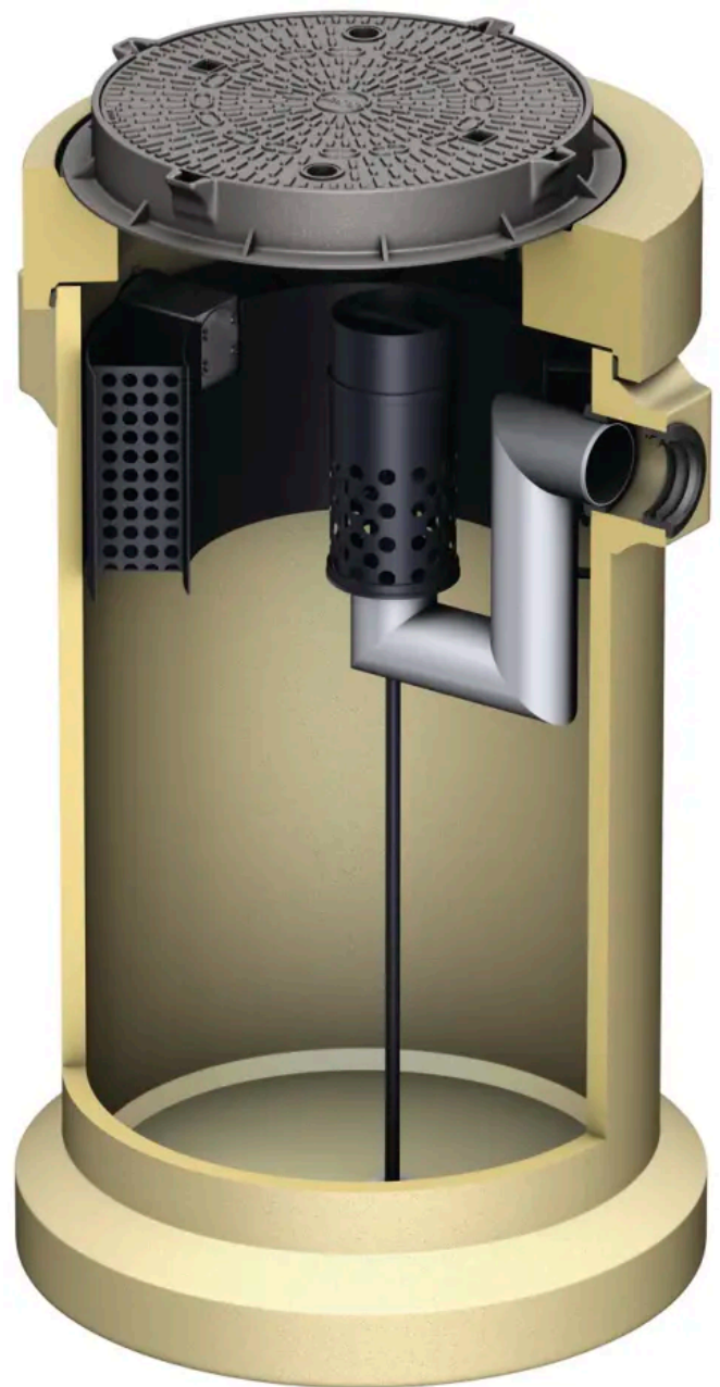
Mit filterloser Koaleszenzeinheit (Polymerbeton) Oleosmart Pro