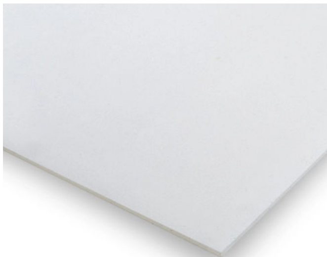
Glasroc F (Riflex)