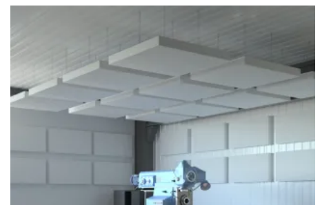
HORIZON Industry Akustiksegel für die Industrie Zum Produkt