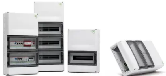
Unterverteilung AK Plus