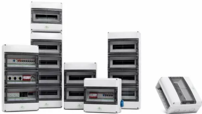
Kleinverteiler AK — AK F

Aus der Serie Spelsberg Installations-Kleinverteiler von Spelsberg