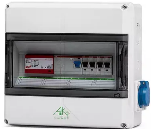
AK Kleinverteiler mit integrierter SCHUKO®-Steckdose

Der AK Kleinverteiler erlaubt die Integration von bis zu vier SCHUKO®-Steckdosen direkt im Gehäuse. Damit stehen bei Wartungsarbeiten benötigte Anschlusspunkte unmittelbar zur Verfügung. Nach dem Ausbrechen der jeweiligen Vorprägungen werden die separat erhältlichen Anbausteckdosen mithilfe der beiliegenden Befestigungsschrauben am Seitenteil fixiert. Die Verbindung mehrerer AK Kleinverteiler ist problemlos möglich. Mit Hilfe von M50-Kombistutzen werden die Kleinverteiler-Gehäuse seitlich fixiert.