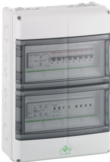
Die AK Kleinverteiler von Spelsberg sind nach EN 60670-24 (VDE 0606-24) zertifiziert.