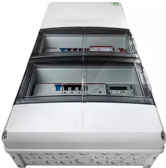
AK Kleinverteiler bieten zusätzlichen Anschlussraum und Hochstromklemmen.

AK Kleinverteiler bieten großzügigen Anschlussraum für bequemes Arbeiten, mehr Optionen bei der Installation und ausreichend Reserven bei Nachrüstungen. Das erweiterte Platzangebot erlaubt eine einschränkungsfreie Handhabung von Drei- und Vierstock-Reihenklemmen. Selbst bei der Installation von Hochstromklemmen bleibt genug Raum, um ein Quetschen von Leitungen mit größeren Querschnitten auszuschließen. Die Variante AK Plus verfügt über einen weiteren Anschlussraum mit einer 35-mm-Normschiene, auf der Einbau- und Reihenklemmen oder Schalt- und Steuergeräte schnell sowie übersichtlich untergebracht werden können. Breite Gehäuseausführungen aller AK-Varianten sorgen dafür, dass 14 statt der üblichen 12 Teilungseinheiten pro Reihe verbaut werden können.