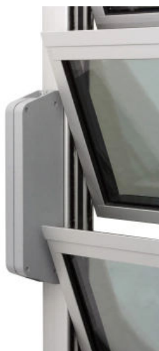
LAH 65 (K) (RWA geprüft EN 12101-2)