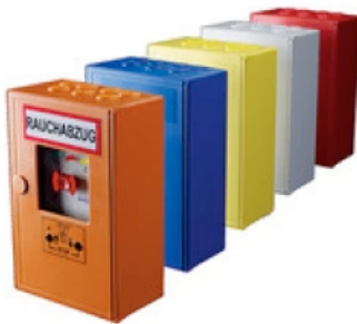
Treppenraumzentrale TRZ Plus Comfort

automatischen Melder, entsprechen den Vorgaben der gültigen Normen und Richtlinien und stellen somit die sichere Funktion dar. Das Raumklima wird durch Sensoren nach den persönlichen Bedürfnissen geregelt, wobei durch Wind- und Regenmelder ein sicheres Schließen je nach Wetterlage garantiert wird. Zur Energieversorgung werden auch Netzteile zum Aufbau von einfachen Steuerungen für 24 V DC Antriebe in Verbindung mit Lüftungstastern, Temperatursensoren oder Hygrostaten verwendet. Je nach Ausführung mit unterschiedlichen Stromabgaben.