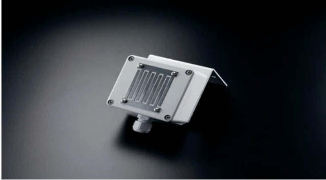
Regenmelder RM/2 24V

Aus der Serie Fensterautomation, Natürliche Be- und Entlüftung, RWA-Anlagen von Kingspan STG