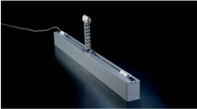
24 V Kettenantrieb LM

Aus der Serie Fensterautomation, Natürliche Be- und Entlüftung, RWA-Anlagen von Kingspan STG