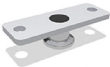
Zubehör RM mini

Eine Vielzahl an Konsolen und Flügelböcken über akustische Melder und Meldekontakte bis hin zur EasyDrive-Software sind erhältlich. Alle Zubehörkomponenten sind abgestimmt auf das individuelle Fenstersystem und die eingesetzten Antriebe.