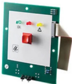
Zusatzmodul RWA-Bedienstelle TRZ/RBH-Basic