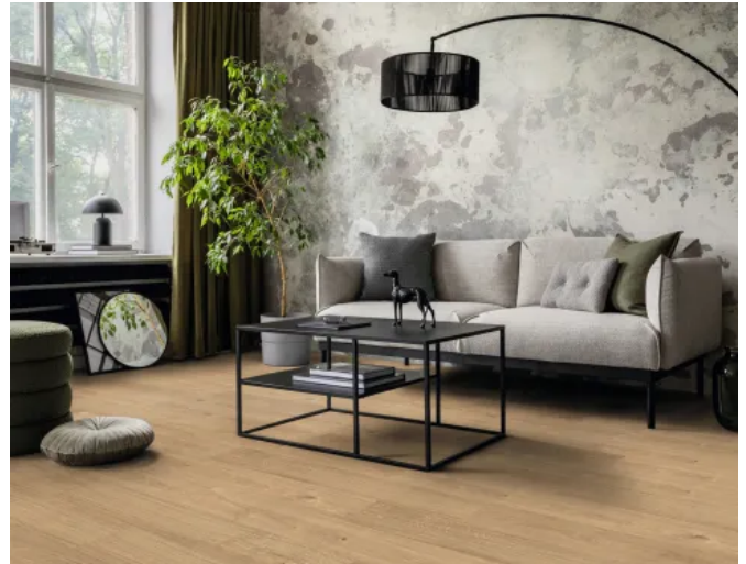
AQUA PRO Wood 0940 LU Eiche Versaille

* Geprüft nach NALFA Standard Laminate Surface Swell Test und nach ISO 4760 (Feuchtigkeitsbeständigkeit bei Einwirkung von oben bei geschlossener Nut Feder Verbindung).