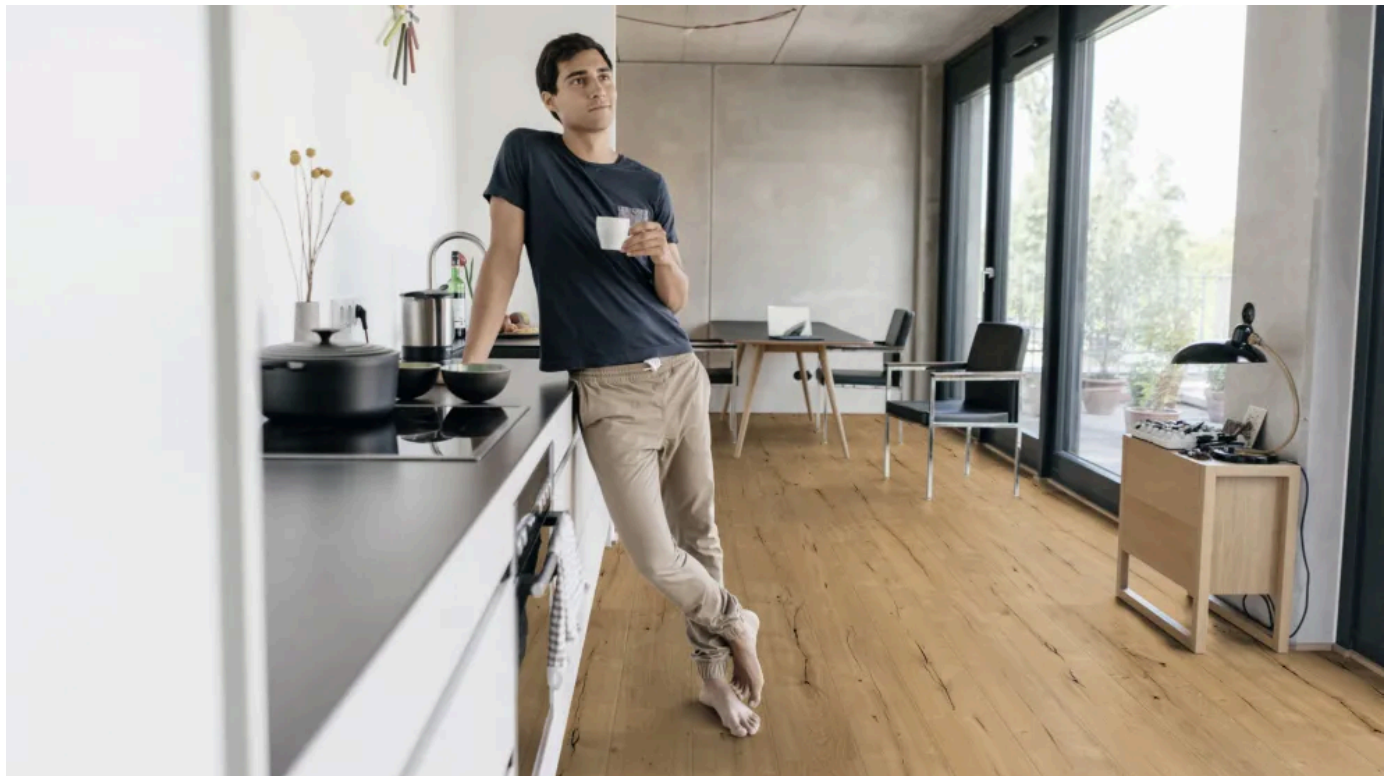
AQUA PRO Wood 0273 LU Eiche Bradford