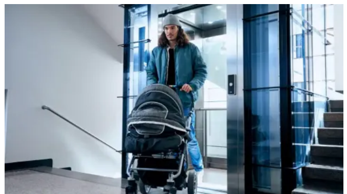
KONE ProSpace™ Plus ist ein maschinenraumloser Personenaufzug für den nachträglichen Einbau in engen Treppenhäusern von Wohngebäuden.

Als platz- und kosteneffiziente Lösung ist KONE ProSpace™ Plus für den nachträglichen Einbau in kurzer Zeit und mit begrenztem Platzangebot konzipiert. Er entspricht den Aufzugsnormen EN 81-20 und EN 81-50. Der KONE ProSpace™ Plus benötigt eine Schachtgrube oder Rampe von nur 10 cm. Die vormontierten Baugruppen lassen sich schnell und ohne weitere bauliche Maßnahmen montieren.